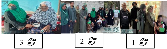
3 ع 3 ع 1 ع

28 - سہولت کاروں کی 28 ویں سالگرہ کی تقریب منعقد کی گئی۔ تقریب میں سہولت کاروں کی جانب سے پیش کردہ تقریب کا انعقاد کیا گیا۔ تقریب میں سہولت کاروں کی جانب سے پیش کردہ تقریب کا انعقاد کیا گیا۔ تقریب میں سہولت کاروں کی جانب سے پیش کردہ تقریب کا انعقاد کیا گیا۔