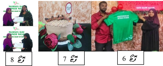
8 ع 7 ع 6 ع

سہولت کاروں کی 28 ویں سالگرہ کی تقریب منعقد کی گئی۔ تقریب میں سہولت کاروں کی جانب سے پیش کردہ تقریب کا انعقاد کیا گیا۔ تقریب میں سہولت کاروں کی جانب سے پیش کردہ تقریب کا انعقاد کیا گیا۔ تقریب میں سہولت کاروں کی جانب سے پیش کردہ تقریب کا انعقاد کیا گیا۔