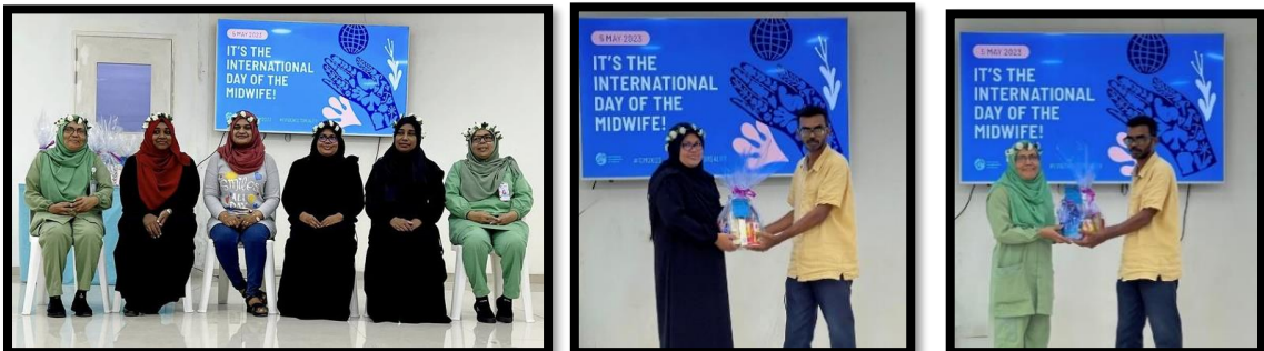
ہائپر ایڈجسٹڈ ایسوسی ایشن نے 05 مئی 2023 کو قراقرم ایسوسی ایشن کی کارکنوں کی اجتماعت منعقد کی

ہائپر ایڈجسٹڈ ایسوسی ایشن نے 05 مئی 2023 کو قراقرم ایسوسی ایشن کی کارکنوں کی اجتماعت منعقد کی۔ اجتماعت میں کارکنوں نے اپنی اپنی ذمہ داریاں اور کاموں کی پیش رفت پر تبادلہء خیال کیا۔