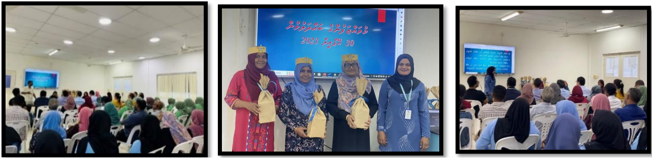
ایسوسی ایشن کارکنوں کی اجتماعت منعقد کی گئی

30 مئی 2023 کو قراقرم ایسوسی ایشن نے ڈیڑھ گھنٹے کی کارکنوں کی اجتماعت منعقد کی۔ اجتماعت میں کارکنوں نے اپنی اپنی ذمہ داریاں اور کاموں کی پیش رفت پر تبادلہء خیال کیا۔