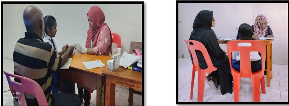
سولہ مئی 2023 کو قراقرم ایسوسی ایشن نے ڈیڑھ گھنٹے کی اجتماعت منعقد کی

سولہ مئی 2023 کو قراقرم ایسوسی ایشن نے ڈیڑھ گھنٹے کی اجتماعت منعقد کی۔ اجتماعت میں کارکنوں نے اپنی اپنی ذمہ داریاں اور کاموں کی پیش رفت پر تبادلہء خیال کیا۔