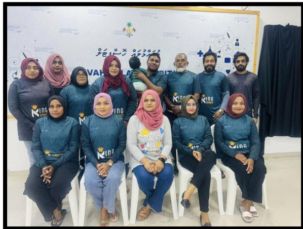
ފަލުގުގެ ސަބަބުން ދިވެހިސަރުކާރުގެ ގެޒެޓްގައި ބަޔާންކުރި ބަޔާންފޮޅު 2023 ވަނަ ފަލުގު ދިވެހިސަރުކާރުގެ ގެޒެޓްގައި ބަޔާންކުރި ބަޔާންފޮޅު.

އިތުރު ސަބަބުން 3 ވަނަ ފަލުގު ދިވެހިސަރުކާރުގެ ގެޒެޓްގައި ބަޔާންކުރި ބަޔާންފޮޅު 2023 ވަނަ ފަލުގު ދިވެހިސަރުކާރުގެ ގެޒެޓްގައި ބަޔާންކުރި ބަޔާންފޮޅު.