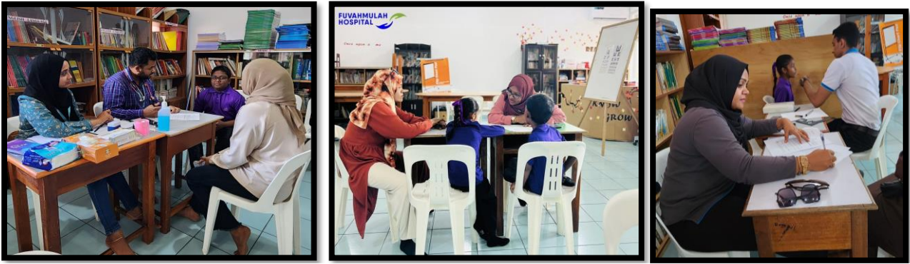
ريج اربدر سناوي قريو سترى رومو سترى اربدر

14 ستمبر 2023 و ستر تروڑ ريج اربدر سناوي قريو سترى رومو سترى اربدر اربدر سترى رومو سترى اربدر سترى رومو سترى اربدر