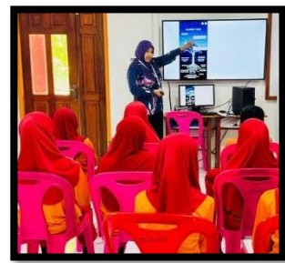
އިތުރު ސަބަބުން 3 ވަނަ ފަލުގު ދިވެހިސަރުކާރުގެ ގެޒެޓްގައި ބަޔާންކުރި ބަޔާންފޮޅު 2023 ވަނަ ފަލުގު ދިވެހިސަރުކާރުގެ ގެޒެޓްގައި ބަޔާންކުރި ބަޔާންފޮޅު.