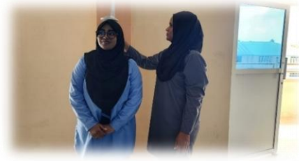
17. "سەر دەرگە ئىسپاتى ئۆزى ئۆزى":