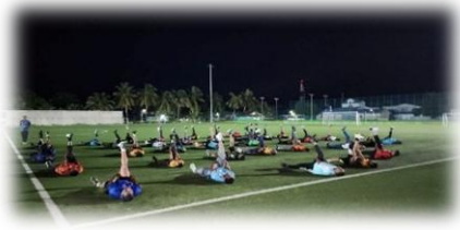
18. سەر دەرگە ئىسپاتى ئۆزى ئۆزى دەرگە ئىسپاتى ئۆزى ئۆزى